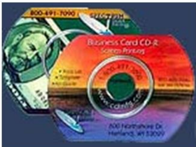
Слика 2 Дигитална визит карта

Дигиталната визит картичка ( Digital Business Card ) е најнов маркетиншки алат за комуникација со клиентите. Со дигиталната визит картичка имаме моќна мултимедиска презентација, која во комбинација со ефектни фотографии, звук, анимации и подвижни слики ги прикажува производите и услугите на нашето претпријатие. Тоа значи дека на атрактивен и модерен начин ги информираме нашите клиенти во насока да ги задржиме или пак да анимираме нови потенцијални клиенти.