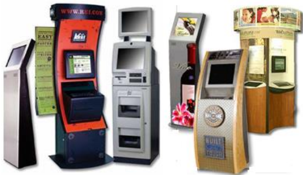
Слика 3 Мултимедиски информациски киосци.