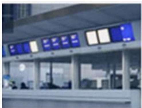
Слика 5 Мултимедиски информациски киоск на железничка станица.