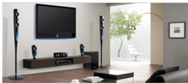
Слика 6 Домашно кино.

Домашно кино е нова техника на прикажување филмови (од ДВД) која се одликува со вонреден квалитет на приказ (острина, репродукција на боите) и звук. Корисникот во домашни услови, по можност на телевизор со поголем екран, со употреба на персонален компјутер со високи перформанси или ЦД плеер, кодек и звучници, го доживува филмот на исти начин како и во кино салите (Слика 6).