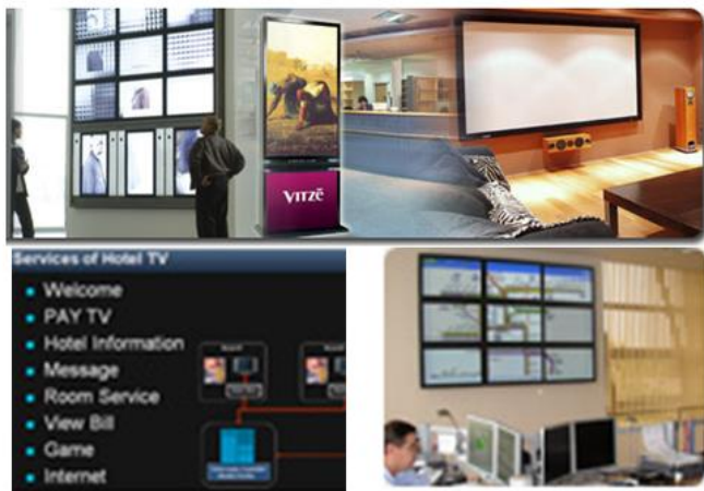
Слика 4 Мултимедиски информациски киосци во хотел.